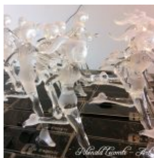
Trophée événementiel – Trophée running – C