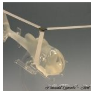
Hélicoptère Gazelle en verre – Passion pilotage – Création 2009 – Trophée d'art en verre sculpté au chalumeau – Rhénald Lecomte – Art Verrier