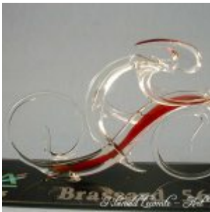
Trophée événementiel – Trophée cycliste – Brassard Crédit agricole 2005 – Création verre plein – Coureur stylisé rouge – Art Verrier

Pour rendre plus expressifs vos événements made in Breiz, pour valoriser avec art votre espace de représentation, Rhéald Lecomte – l'art Verrier – vous offre son savoir-faire d'artiste verrier en matière de création de trophées d'art.