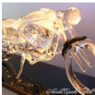
Trophée d'art passion 2015 – Bobber Harley-Davidson – Moteur de caractère et style dépouillé par essence – Trophée sculpture sur socle en verre noir – Rhénald Lecomte – Art Verrier