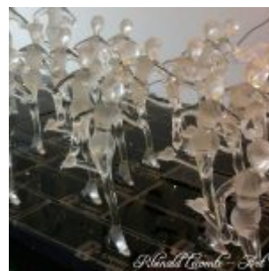
Trophée événementiel – Trophée