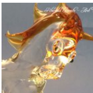
Trophée sculpture cheval en verre – Trophée d'art animalier 2019 – Passion du cheval exprimée à travers un cheval en verre plein façonné au chalumeau – Art Verrier

Création d'art ou cadeau d'exception , le trophée en verre devient surtout message personnalisé pour exprimer une passion envers un animal aimant et amical, une passion sportive ou une passion à caractère technique.