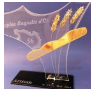
Trophée boulangerie – Trophée d'excellence Baguette d'or – Artisan – Création d'art artisanale en verre – 2016 – Art Verrier – La Gacilly