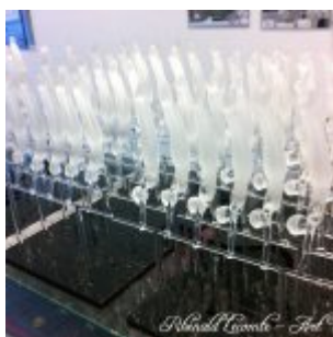
Trophée Sapeurs- pompiers Paris – Sculptures

Une « série » artisanale qui permet de répondre à une commande mais aussi in fine de démultiplier la source d'un récit artistique, le plaisir de nombreux récipiendaires.