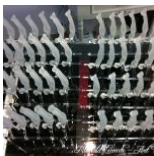
Trophée Sapeurs- pompiers Paris – Vue