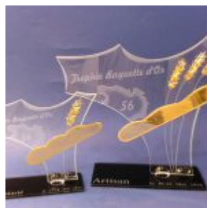
Trophée boulangerie en verre – Trophée d' excellence Baguette d'or –