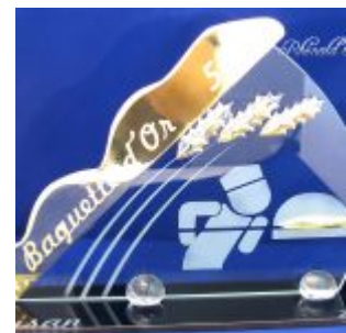
Trophée boulangerie en verre – Trophée d' excellence Baguette d'or –