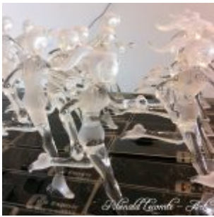
Trophée événementiel – Trophée running – C un espoir 2015 – Lutte contre le cancer des enfants – Foulées féminines sculptées en verre plein – Art Verrier