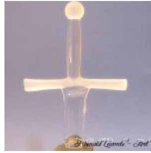
Trophée événementiel – Trophée Trail des légendes de Brocéliande 2014 – Plan rapproché épée sculptée en verre plein satiné – transparent – Sculpture de créateur – Art Verrier