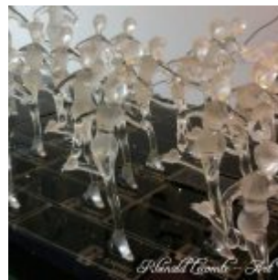
Trophée événementiel – Trophée course à pied – C un espoir 2015 – Lutte contre le cancer des enfants – Sculptures verre plein – Art Verrier